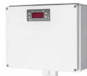
Receptor del sensor PT100